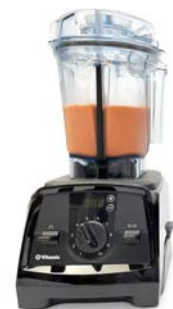
褐変防止ピューレ (特許出願予定)