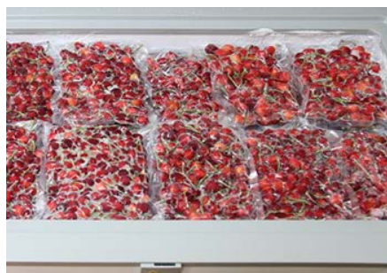
買取した完熟佐藤錦を特殊冷凍保存