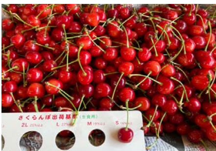
出荷出来ない完熟佐藤錦を買取

※食べ頃でご家庭へ届けるため完熟前に収穫されてしまい 100% のおいしさは農家でしか味わえない。